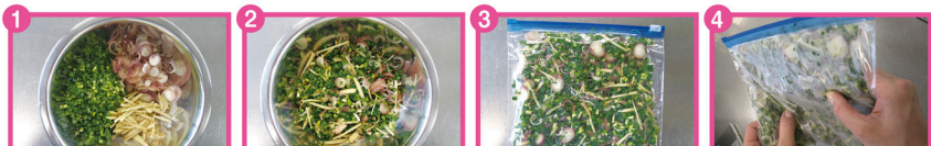
1 青ネギは5mm幅、みょうがは2mm幅の小口切り、生姜は千切りする。 2 丁寧にしっかりと混ぜ合わせる。 3 ジップロックに薄く平らに入れて空気をぬいて冷凍する。 4 凍ったまま、使いたい分だけ折ってほぐし取り出す。

材料は【●青ネギ・1束 ●みょうが・2~3個 ●生姜・10g】ジップロックに入れる際はしっかり空気を追い出しましょう。また、薄く平らに入れて冷凍すれば、使いたい時に凍ったまま必要な分だけ折って袋の上から揉むようにするだけで簡単にほぐれます。ネギの甘さと、みょうがの香り、さらには生姜の辛みを同時に楽しめるこの冷凍薬味ミックス。常備しておくとお料理の時短にも繋がり便利です。ので、ぜひお試しください。